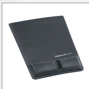
Nr kat.: 9184001