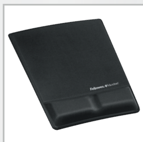
Nr kat.: 9181201